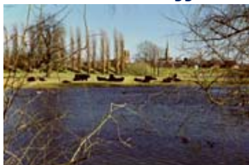
Nummer 6 op de kaart: De Ronde Haven