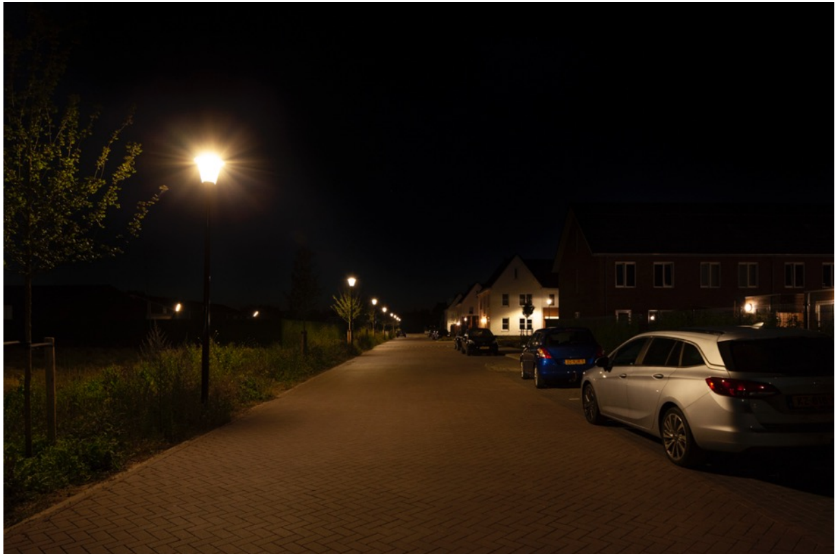
Foto: Riek van Haarenstraat. Goede gelijkmatige verdeling van het licht op het wegdek waardoor er geen zwarte vlekken ontstaan.

De gelijkmatigheid kan ook bijdragen aan een gevoel van veiligheid.